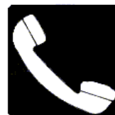
Teléfono de salvamento