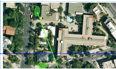
Puntos de Reunión Exterior

"Calle Serrano a la altura del número 150"